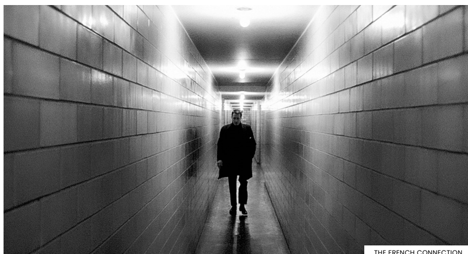
THE FRENCH CONNECTION

Foi por este filme que Michael Mann processou (sem sucesso) Friedkin por plágio da célebre série televisiva Miami Vice dos anos oitenta que então corriam (e ele, Mann, viria a bem adaptar ao cinema em 2006). O argumento de TO LIVE AND DIE L.A. parte do romance de um ex-agente secreto, Gerald Petievich, seguindo as reviravoltas da história de dois agentes secretos dispostos a ir longe na perseguição de um criminoso no que acaba por tornar-se uma questão de obsessiva vingança pessoal para além das normas da lei. Terá sido a “natureza surrealista” do