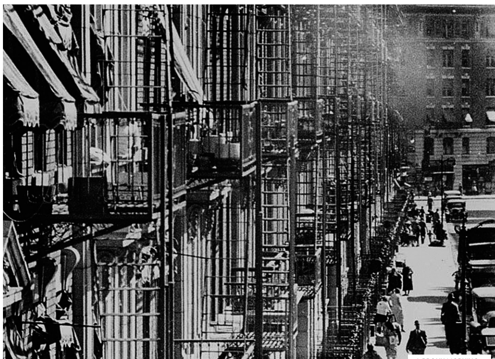
A BRONX MORNING