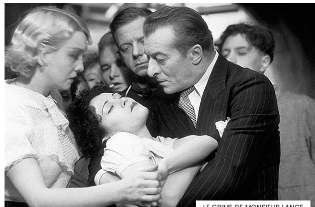
LE CRIME DE MONSIEUR LANGE

A Cinemateca volta a celebrar o Dia Mundial do Património Audiovisual, sempre comemorado pelos membros da FIAF – Federação Internacional dos Arquivos de Filmes a 27 de outubro. Assim se evoca a data em que, na Assembleia Geral de Belgrado em 1980, a UNESCO adotou a Recomendação para a Salvaguarda e a Conservação das Imagens em Movimento . Em 2023, comemoramos a data com um grande clássico, SPELLBOUND, de Alfred Hitchcock, a exibir em versão restaurada.