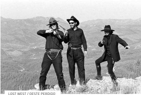
LOST WEST / OESTE PERDIDO