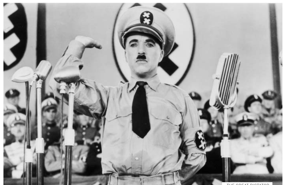
THE GREAT DICTATOR

entre a projeção dos dois filmes há um intervalo de 30 minutos