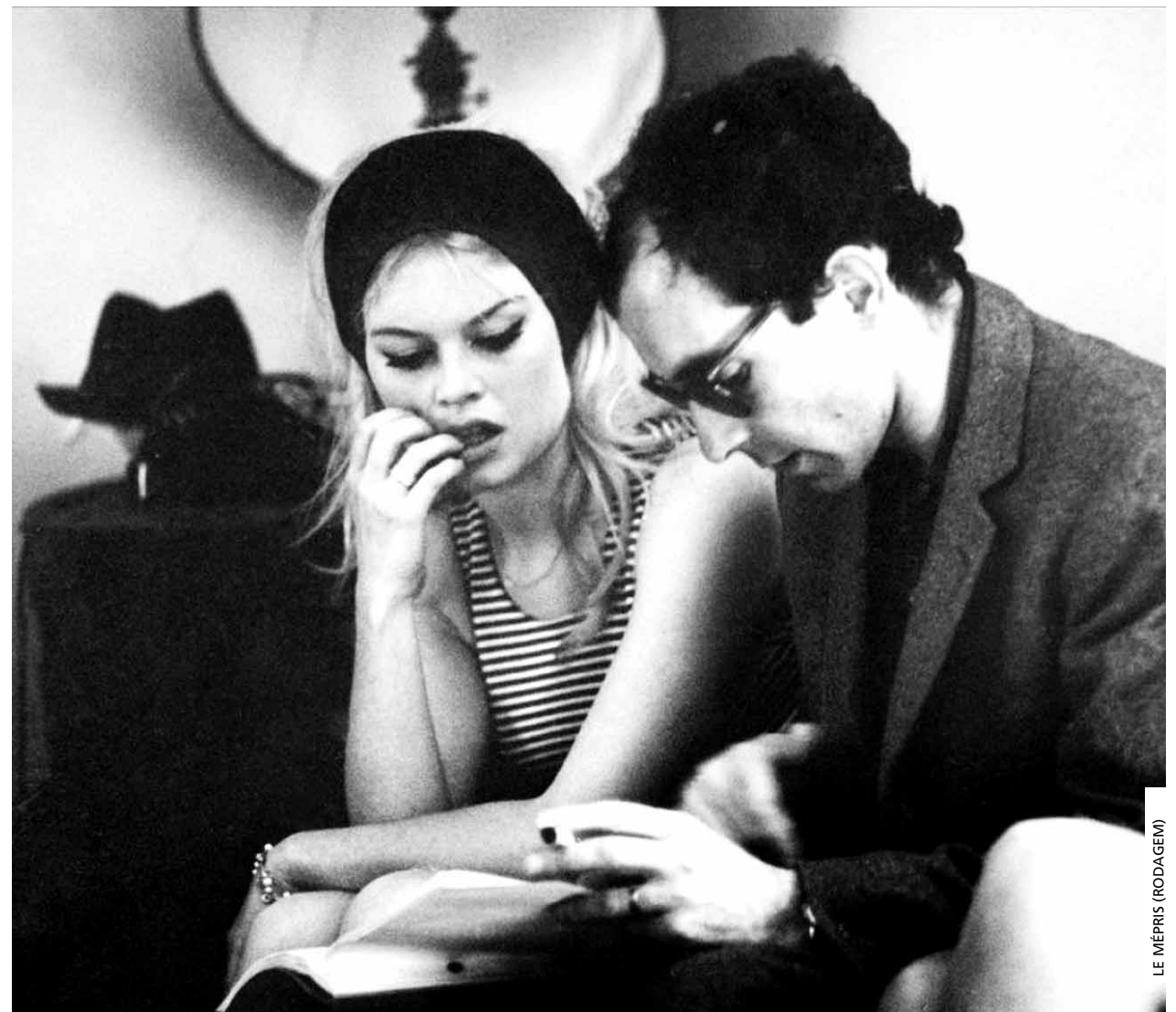
LE MÉPRIS (RODAGEM)

As intervenções de André S. Labarthe serão feitas em francês, sem tradução simultânea. Para esta rubrica, a Cinemateca propõe um regime de venda de bilhetes específico, fazendo um preço especial e dando prioridade a quem deseje seguir o conjunto das sessões. Assim, quem deseje seguir todas as sessões poderá comprar antecipadamente a sua entrada pelo preço global de 12 euros a partir do dia 9 (venda exclusiva para a totalidade das sessões, máximo de duas colecções por pessoa). A partir de 16 de Janeiro, os lugares que não tenham sido vendidos antes serão disponibilizados através do normal sistema de venda no próprio dia de cada sessão, no horário de bilheteira habitual e de acordo com o preço habitual.