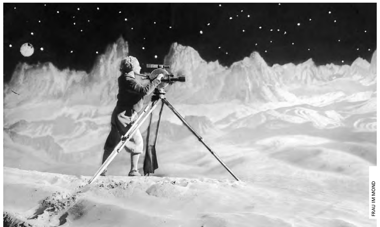
FRAU IM MOND