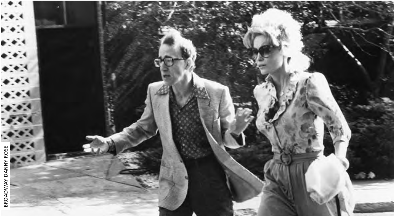
BROADWAY DANNY ROSE

Em 2012, tempo de várias mudanças, as sessões das 15h30 deixam de ser exclusivamente “clássicas”. Mantêm-se, como rubrica regular de programação, “Matinés”, alargando o espectro dos filmes a apresentar, que não dispensará os clássicos mas incluirá uma maior diversidade de propostas. Alinhando pela batuta das matinés dos últimos anos, a abertura faz-se com Judy Garland e o celeberrimo THE WIZARD OF OZ. Há musicais de Minnelli e Bob Fosse, filmes de Cukor, Ford, Hawks, Lubitsch, Henry Coster, Leisen, Curtiz, Vidor, Wyler, Visconti, Bergman, De Sica, Truffaut, Woody Allen, Polanski, Ridley Scott, e primeiras exposições nestas salas, como SHORT CIRCUIT de John Badham; MOVIE MOVIE de Stanley Donen; THE WAR BETWEEN MEN AND WOMEN de Melville Shavelson.