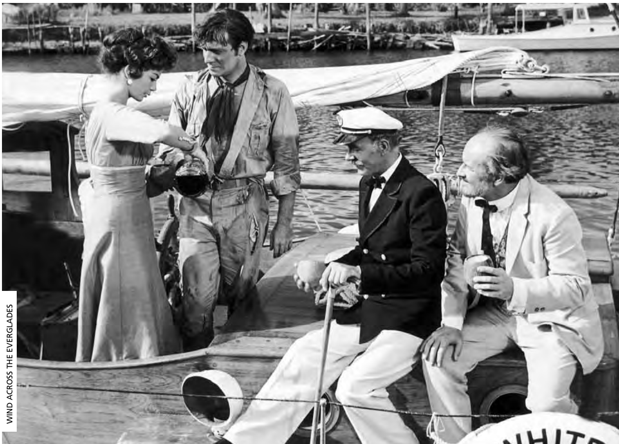
WIND ACROSS THE EVERGLADES

> Sex. [13] 21:30 | Sala Dr. Félix Ribeiro