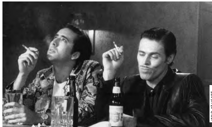
WILD AT HEART

Nove sessões abrem 2012 com sugestões dos espectadores de 2011. Entre o lote, sempre abundante e variado, a selecção recaiu sobre produções portuguesas, filmes de Oliveira, César Monteiro, Nascimento e Sá Caetano. Mas não exclusivamente. E seguindo a heterogeneidade das sugestões, também há filmes de Frederick Wiseman, Milos Forman, Hal Hartley, Straub-Huillet, David Lynch.