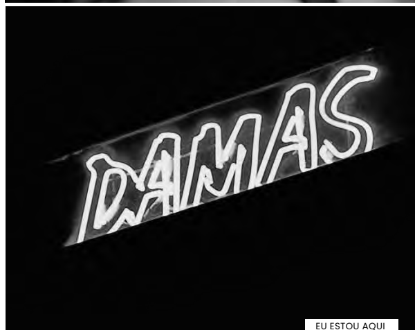
EU ESTOU AQUI