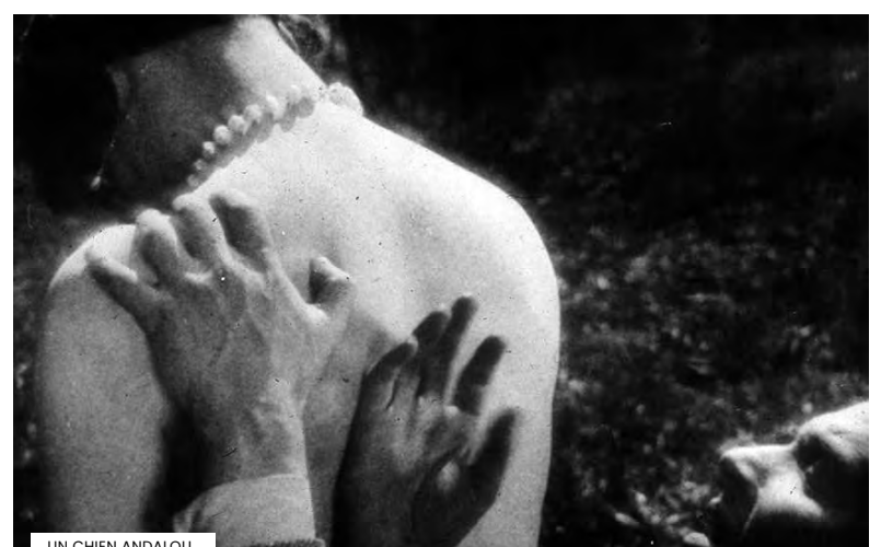
UN CHIEN ANDALOU

THÈMES ET VARIATIONS é um dos pouco conhecidos e muito surpreendentes filmes da vanguardista francesa Germaine Dulac – “Evoco uma bailarina! Uma mulher? Não. Uma linha saltitante de ritmos harmoniosos! Evoco uma projeção luminosa velada! Matéria precisa! Não. Ritmos fluidos. Porquê desconsiderar, no ecrã, o prazer que o movimento nos dá no teatro? Harmonia de linhas. Harmonia de luz. Linhas, superfícies, volumes [...] cinema integral” (Dulac). No alinhamento da sessão, o segundo filme de Germaine Dulac tem argumento de Antonin Artaud, uma história de desentendimento entre os dois e a da ferocidade levantada na histórica estreia contra a realizadora, em 1928, no Studio des Ursulines. Hoje Dulac é descrita como uma feminista pioneira das vanguardas dos anos 1920 e LA COQUILLE ET LE CLERGYMAN (o seu filme mais célebre a par de LA SOURIANTE MADAME BEUDET, de 1923) é tido como o primeiro filme surrealista da História do cinema, um estudo sobre o ritmo que também é comum aparentar ao lirismo, ao impressionismo ou à influência do simbolismo. É um belo filme de um experimentalismo estonteante, decerto uma incursão precursora no subconsciente humano. Baseado numa série de sonhos de Luis Buñuel e Salvador Dalí, UN CHIEN ANDALOU (a apresentar em cópia digital) é um violento e extraordinário filme surrealista – “um apaixonado apelo ao homicídio”, segundo os seus autores –, um dos filmes vanguardistas mais famosos de sempre.