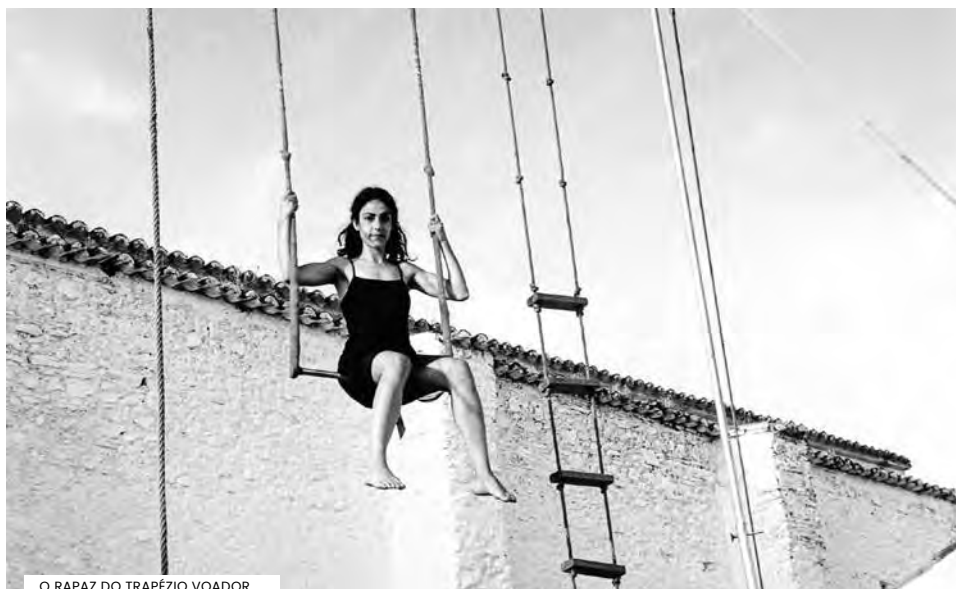
O RAPAZ DO TRAPÉZIO VOADOR