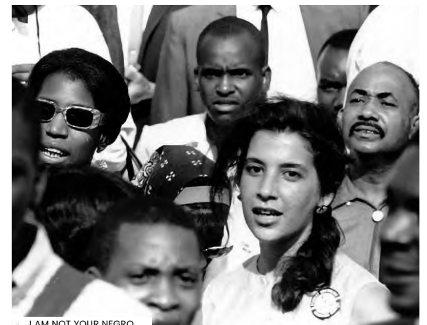
I AM NOT YOUR NEGRO

► Quarta-feira [03] 19h00 | Sala M. Félix Ribeiro