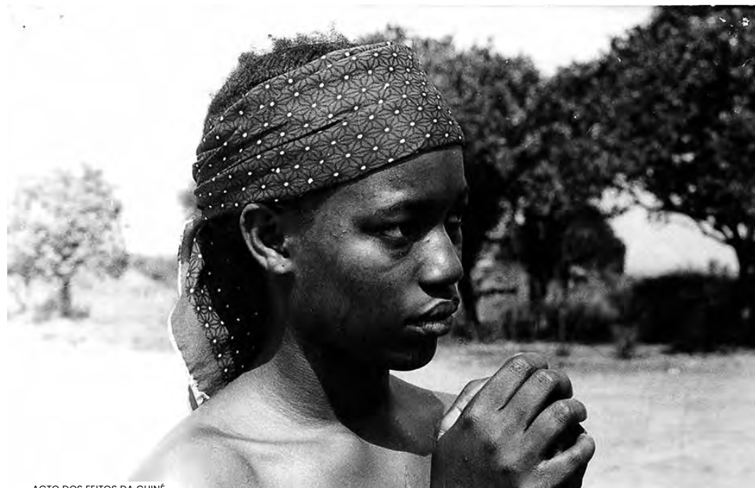
ACTO DOS FEITOS DA GUINÉ

Thriller psicológico fantástico sobre um marinheiro (o primeiro papel de Dennis Hopper no cinema) que se apaixona por uma mulher que trabalha com um grupo de saltimbancos, interpretando o papel de uma sereia com poderes de adivinhação. Só que Mora (Linda Lawson) é conhecida por dar azar a todos os homens com quem se envolve. O mau-olhado que sobre ela recai leva Johnny a suspeitar que, talvez, Mora não esteja simplesmente a interpretar uma sereia, mas que seja de facto um ser anfíbio habituado a matar os seus amantes nas noites de lua cheia. Um filme de culto fortemente inspirado pelo universo de Edgar Allan Poe.