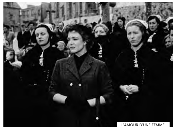
L'AMOUR D'UNE FEMME

► Quarta-feira [03] 21h30 | Sala M. Félix Ribeiro