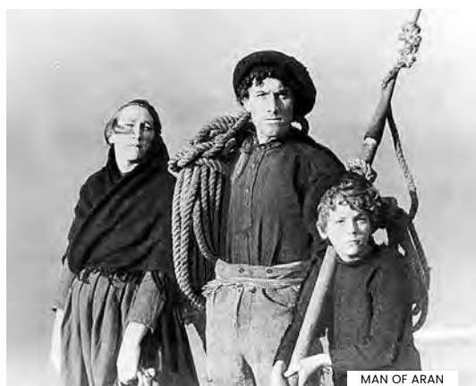
MAN OF ARAN