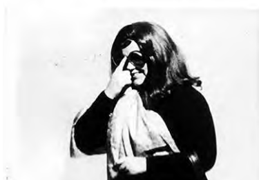
QUE FAREI EU COM ESTA ESPADA?