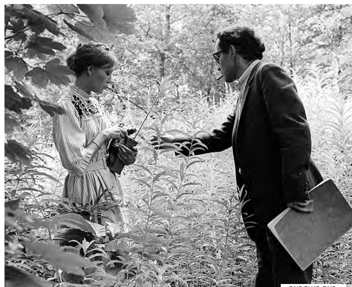
ONE PLUS ONE