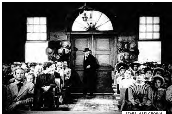
STARS IN MY CROWN