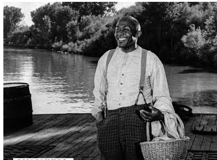
THE SUN SHINES BRIGHT

de NANOOK OF THE NORTH e MOANA], injeta no assunto a dimensão da gesta coletiva e a marca sacrificial da comunidade filmada" (José Manuel Costa). A apresentar em cópia digital.