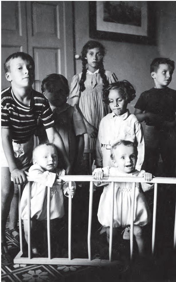
MARK PUÒ ASPETTARE

uma falsa autobiografia de Howard Hughes) e mostra como o cinema é a arte suprema dessas ilusões. Particularmente o seu. É um filme parcialmente feito "em casa".