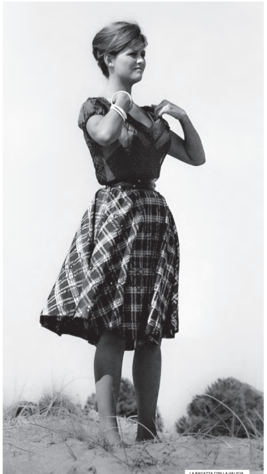
LA RAGAZZA CON LA VALIGIA