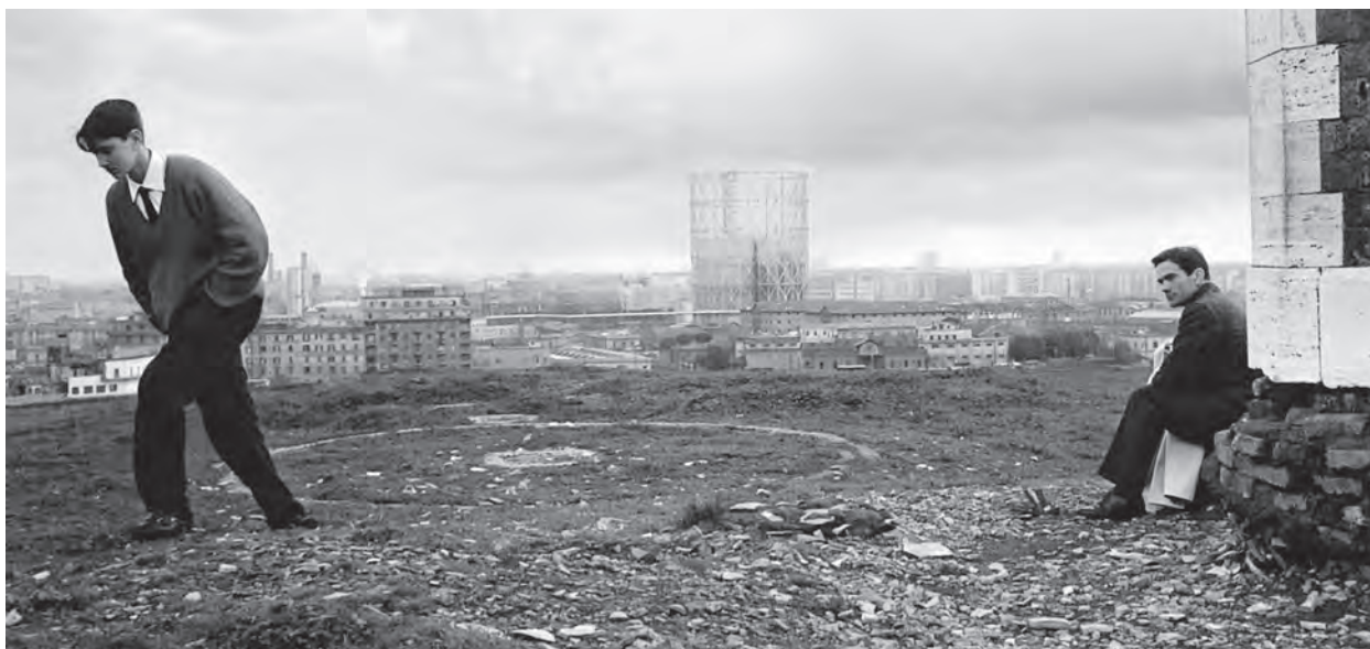
LA RABBIA DI PASOLINI