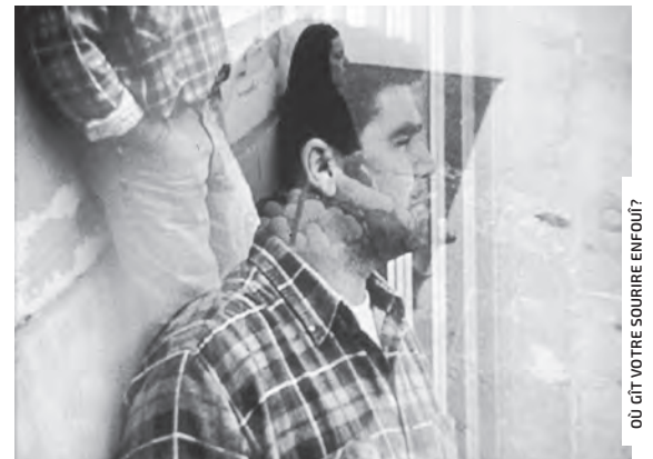
OÙ GÎT VOTRE SOURIRE ENFOUÏ?