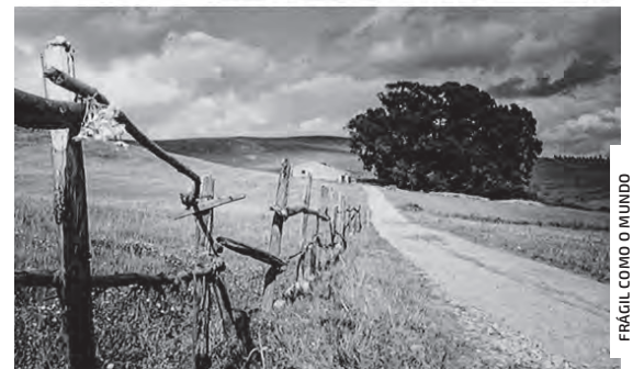
FRÁGIL COMO O MUNDO