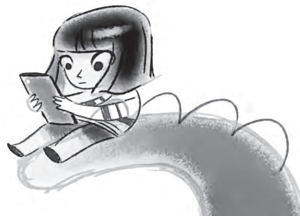
A MENINA COM OS OLHOS OCUPADOS

As sementes da época são variadas: JOJO RABBIT de Taika Waititi, para pensar através da sátira e do riso nas ideologias e governantes que matam, e uma fornada de cinco curtas-metragens de animação para os mais tenrinhos (M/3) – CURTAS WARM-UP INDIEJÚNIOR – com filmes escolhidos a dedo pela JÚNIOR e INDIEJÚNIOR. Seguindo o exemplo de Ana Hatherly no seu filme REVOLUÇÃO e na obra "As Ruas de Lisboa" feita de sobreposições, colagem e descolagem de cartazes de Abril, vamos construir os nossos CARTAZES EM LIBERDADE para dia 25 descermos a avenida em festa.