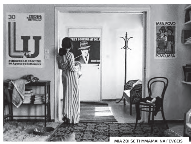
MIA ZOI SE THYMAMAI NA FEVGEIS