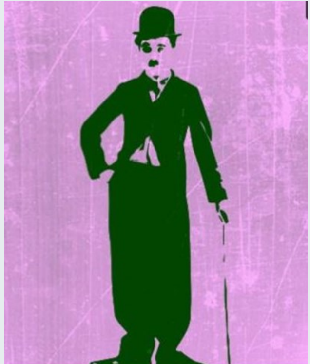
Imagem: RTP Ensina

https://ensina.rtp.pt/artigo/charlot-a-arte-de-comunicar-sem-palavras/