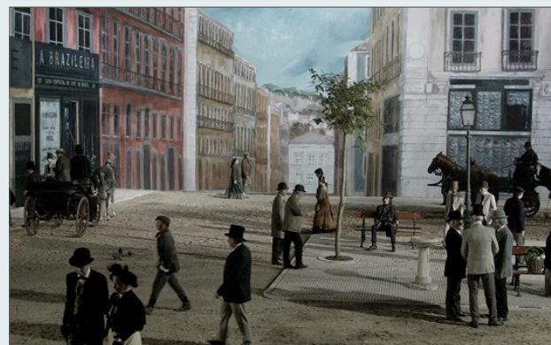
Fotograma de Os Maias

fbclid=IwAR0XejRZISZ1xRKS4myoYLFxv5clsj1n9fkk4p8dc8d41mhBBL6Qag8dZjk