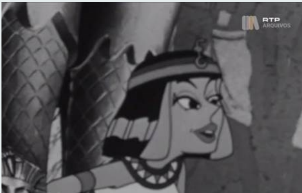
Asterix e Cleópatra (1968), Uderzo e Goscinny, fotograma do Programa.