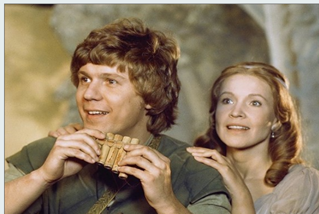
Fotograma de A flauta mágica

https://www.rtp.pt/play/p6900/e460424/a-flauta-magica