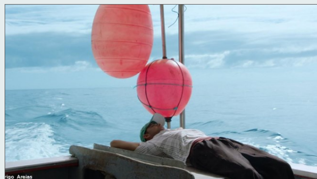
Fotograma de Hálito Azul

https://www.rtp.pt/play/p6915/halito-azul