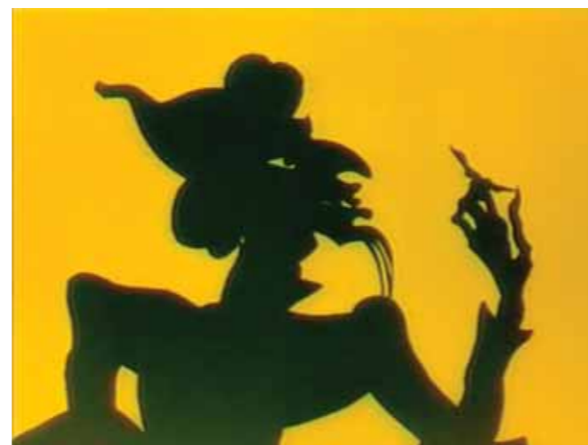
AS AVENTURAS DO PRINCE AGHMEH Lotte Reiniger

Descobriremos um filme que marcou este género cinematográfico.