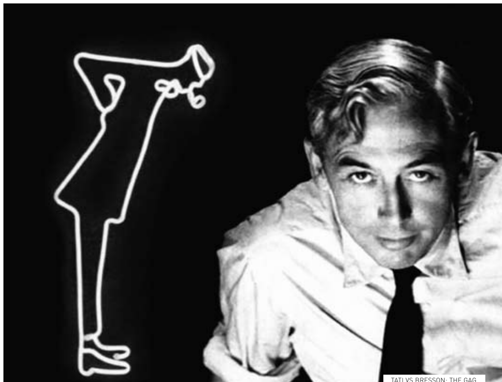
TATI VS BRESSON: THE GAG

▶ Sala M. Félix Ribeiro | Qua. [3] 19:00