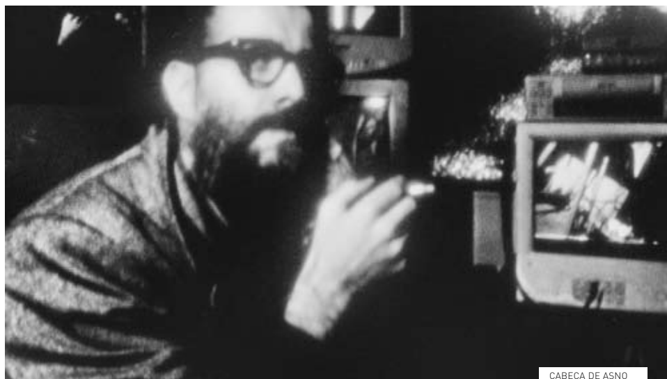
CABEÇA DE ASNO

Em maio, continuamos o Ciclo sobre as novas propostas do cinema português, apresentando, assim, o terceiro tomo de trabalhos que têm recebido atenção, no nosso país e fora dele, pela sua crescente força e diversidade. Será também organizado um novo debate, desta vez, com os cineastas de filmes apresentados em abril, no dia 4, às 18h30, na Sala Luís de Pina. Em junho, o Ciclo encerra com um epílogo, onde vão ser apresentados filmes que fogem, de certa forma, às regras impostas a este programa: cineastas nascidos depois de 1974 e com mais do que uma obra estreada publicamente no seu currículo.