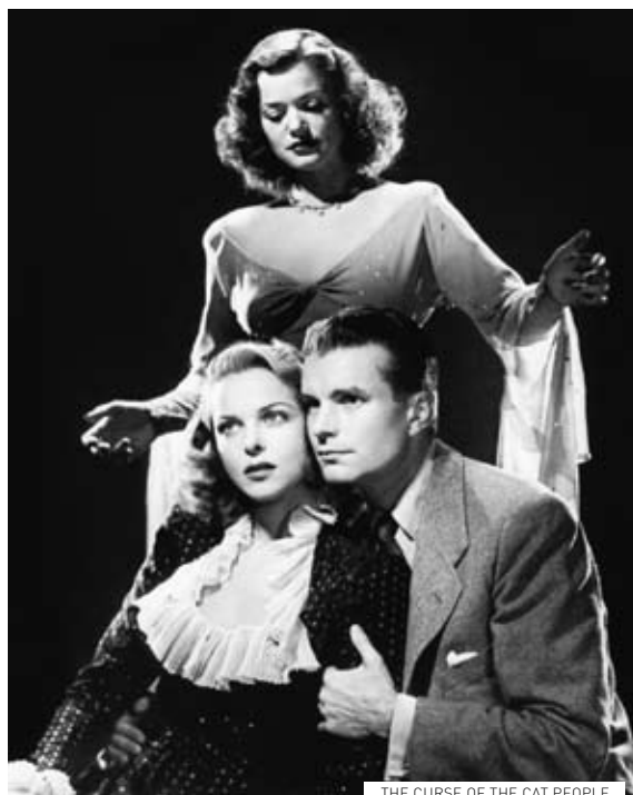
THE CURSE OF THE CAT PEOPLE