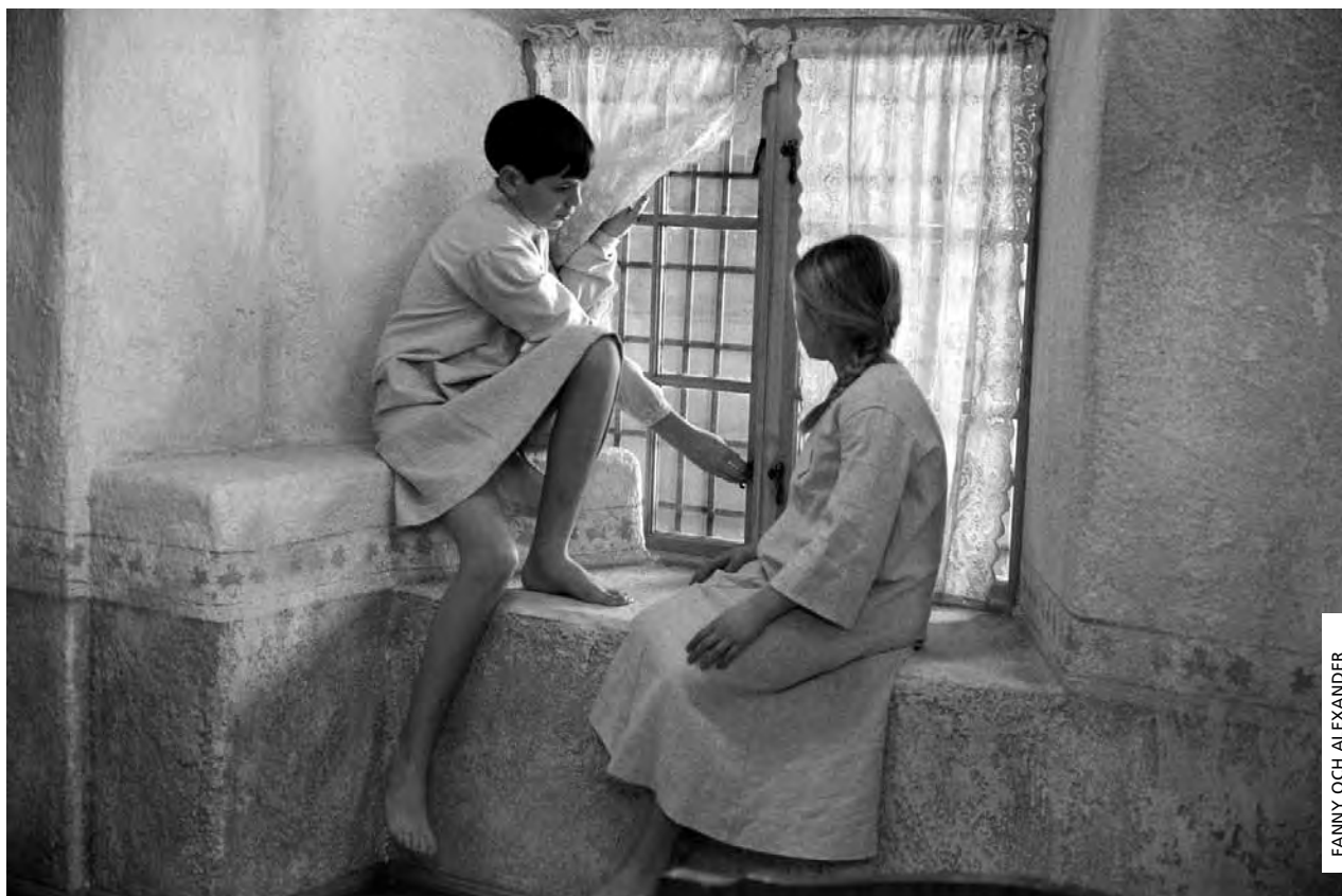
FANNY OCH ALEXANDER

A diversidade continua a fazer parte das matinés da Cinemateca em maio, juntando grandes clássicos de Howard Hawks, Alfred Hitchcock e Raoul Walsh com obras mais recentes de Cronenberg ou Woody Allen. Inédito na Cinemateca é KANSAS CITY, longa-metragem de Robert Altman que estreou nas salas portuguesas em 1996.