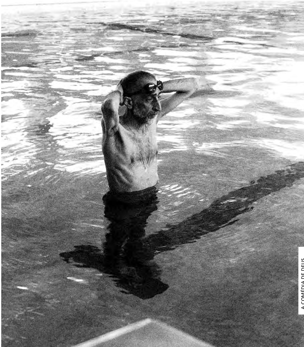
A COMÉDIA DE DEUS

Mês generoso para as sugestões dos espectadores, maio tem onze sessões programadas como resposta a "O Que Quero Ver": clássicos de Powell e Pressburger, Buñuel, Eisenstein, Stroheim, e ainda Fassbinder, dois conhecidos filmes de Scorsese e dos irmãos Taviani, um "filme do degelo" de Grigori Chukhrai, um filme de João César Monteiro/João de Deus e a estreia de James Gray na Cinemateca com TWO LOVERS.