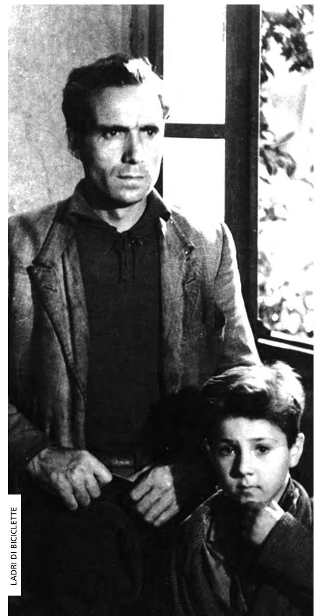
LADRI DI BICICLETTA

> Qui. [24] 21:30 | sala Dr. Félix Ribeiro