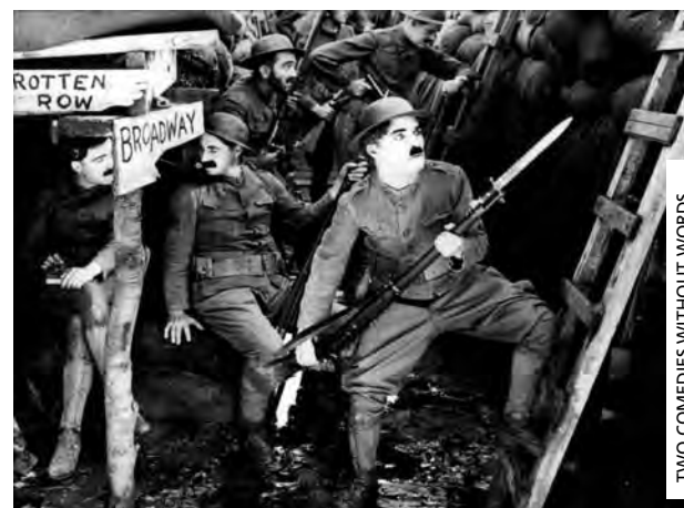
TWO COMEDIES WITHOUT WORDS