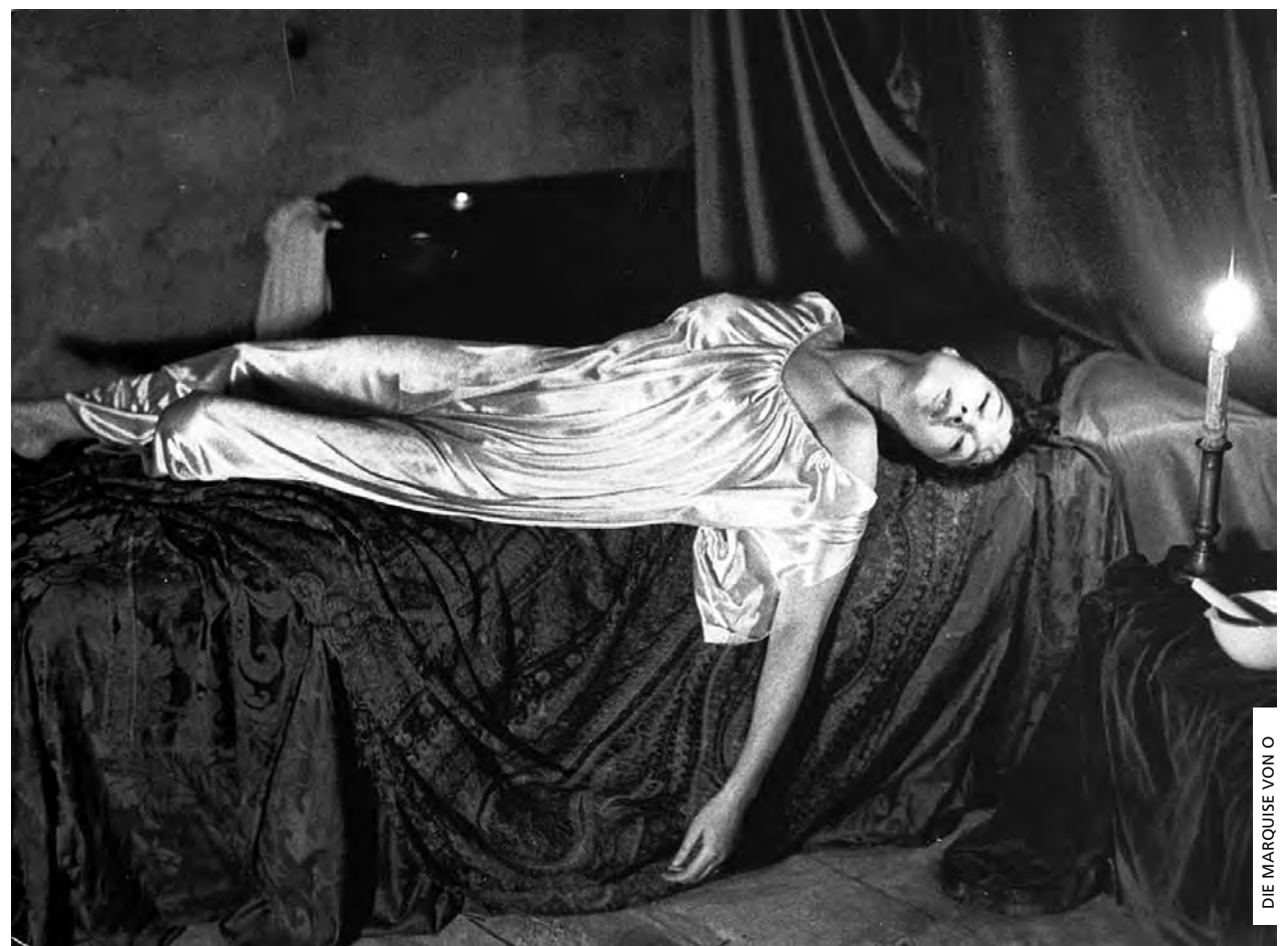
DIE MARQUISE VON O

> Qui. [31] 15:30 | sala Dr. Félix Ribeiro