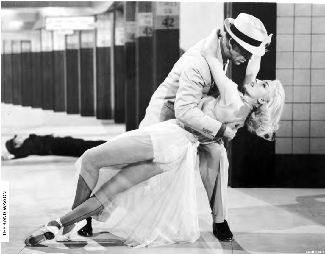
THE BAND WAGON