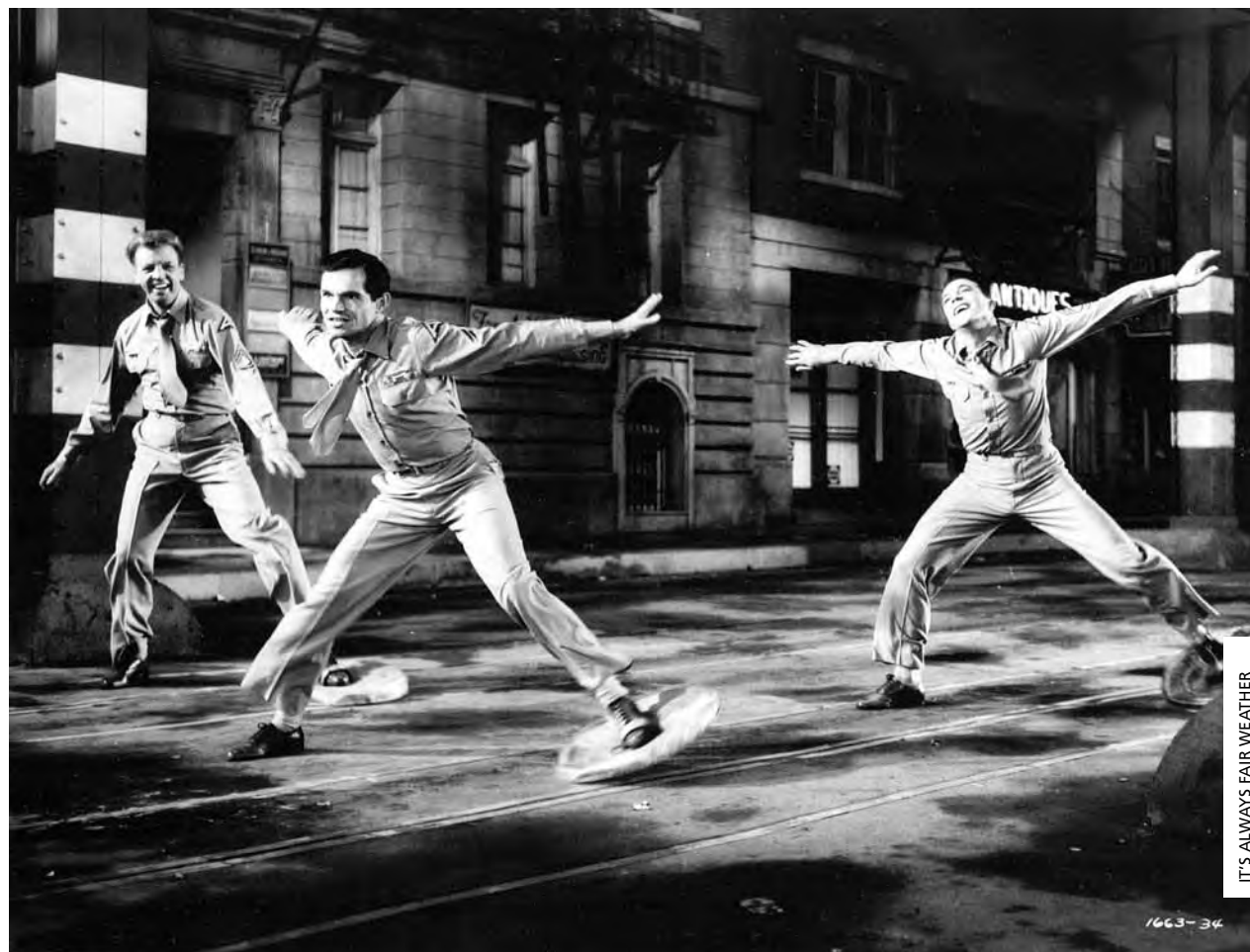
IT'S ALWAYS FAIR WEATHER