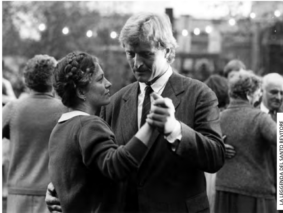
LA LEGGENDA DEL SANTO BEVITORE

A retrospectiva Ermanno Olmi conclui-se com a exibição de um conjunto de longas-metragens e duas sessões dedicadas às curtas iniciais realizadas no contexto da companhia Edisvolta. Se o mundo do trabalho ocupa o centro dos primeiros filmes de Olmi, esta realidade mantém-se em grande parte das longas-metragens que invariavelmente abordam a realidade da sociedade italiana e as suas transformações. Uma das principais características do cinema de Olmi reside no modo como construiu a maioria da sua obra à margem do cinema comercial e das suas convenções narrativas, reinventando permanentemente as suas formas e modos de produção. Fortemente associado à tradição neorrealista, pela predominância de cenários naturais, por uma opção frequente por não-atores e pela atenção ao real, todos os seus filmes, sejam documentários ou ficções, revelam um olhar muito particular sobre o quotidiano. Este mês exibimos filmes tão diferentes como I RECUPERANTI , uma belíssima ficção que rima com IL TEMPO SI È FERMATO , IL MESTIERE DELLE ARMI , filme histórico que manifesta as mesmas preocupações que L'ALBERO DEGLI ZOCCOLI ao nível da reconstituição de um período específico da história e da vida italiana, ou IL VILLAGGIO DI CARTONE , o último filme de Olmi, que revela como o cineasta continua a renovar o seu universo, mas permanece fiel ao essencial do seu cinema.