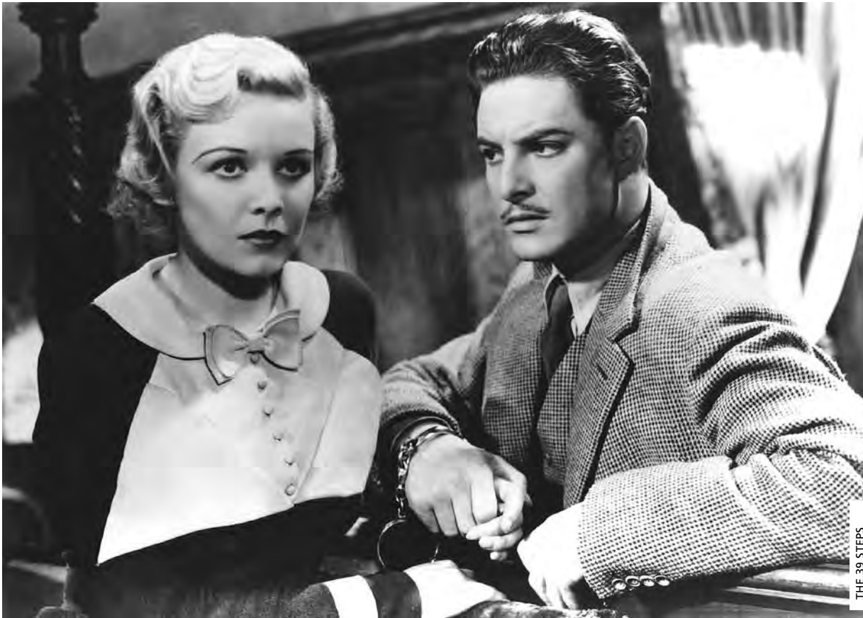
THE 39 STEPS

o filme tem uma forte carga erótica e é um dos pontos altos da obra de um dos mestres do período clássico.