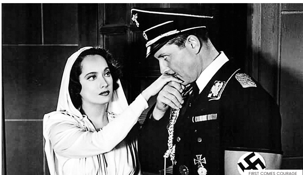
FIRST COMES COURAGE

No seu filme MGM com Joan Crawford (que ia no sétimo e último dos títulos em que contracenou com Franchot Tone), Arzner adapta uma peça de Ferenc Molnar, mais conhecido como autor de Liliom (peça de 1909, adaptada ao cinema por Michael Curtiz ou Fritz Lang), e diverte-se nos