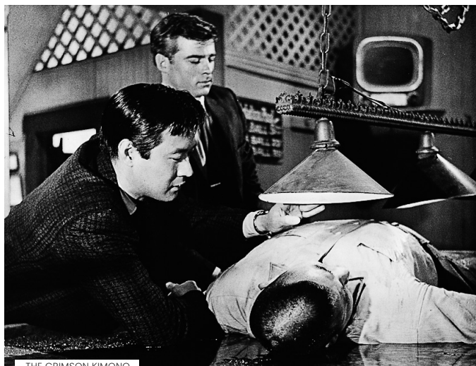
THE CRIMSON KIMONO

Com argumento de Oliver Stone, YEAR OF THE DRAGON representou o regresso de Michael Cimino à realização depois do colossal fracasso da sua obra-prima HEAVEN'S GATE. Mudam os ambientes, mudam os meios (bem mais modestos do que no filme anterior), não mudam as obsessões de Cimino: através da figura de Stanley White (Mickey Rourke), um polícia de origem polaca, violento e racista, obcecado pela caça a um czar da droga (John Lone) que domina a Chinatown de Nova Iorque, YEAR OF THE DRAGON é mais uma observação da natureza compósita do tecido étnico e social dos Estados Unidos, e uma repetição da mais ambígua das perguntas: o que é ser americano? A resposta, como sempre, não é necessariamente agradável. THE CRIMSON KIMONO é um thriller realizado com a força e a secura habituais de Samuel Fuller, situado em Los Angeles: dois inspetores da polícia, um branco e um asiático, investigam o homicídio de uma strip teaser. Além de colegas, os dois homens são velhos amigos, mas acabam envolvidos num triângulo amoroso, que os torna rivais diante de outra mulher. Um filme relativamente pouco visto do mestre Fuller.