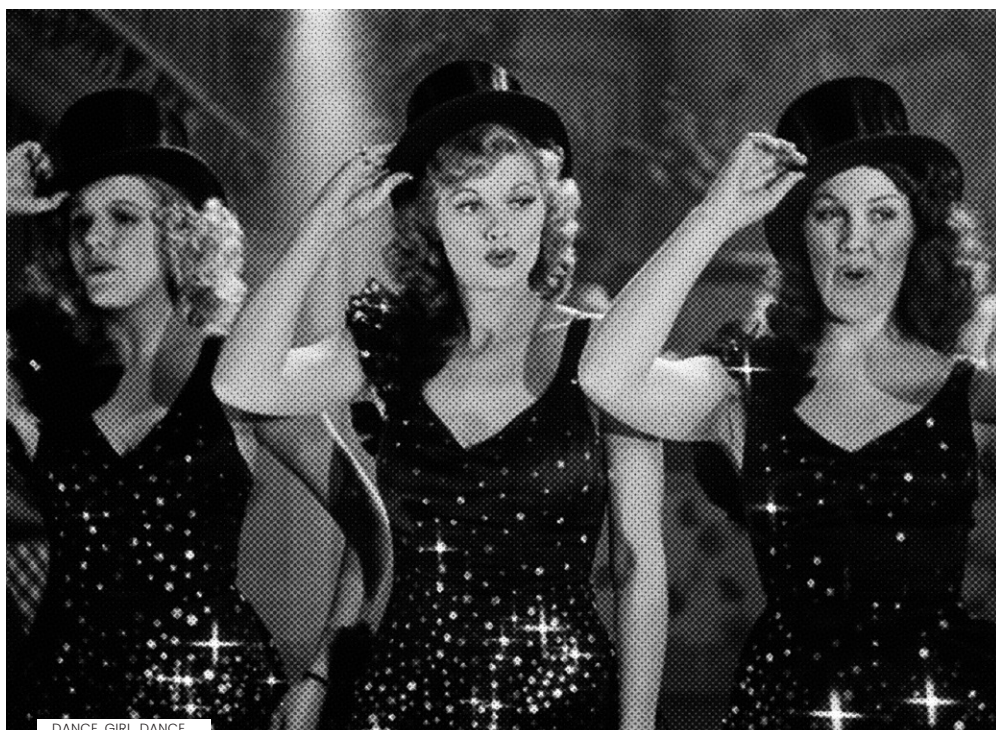
DANCE, GIRL, DANCE