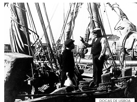
DOCAS DE LISBOA

A curta-metragem é, no cinema português, vasto campo para a experimentação, a descoberta e a possibilidade de se inventar modos narrativos mais próximos e atentos ao detalhe. O FILMAR volta a juntar-se ao programa O Dia Mais Curto, projeto europeu promovido, em Portugal, pela Agência da Curta-Metragem, com uma seleção de títulos de autores contemporâneos em diálogo com a memória, a partir das temáticas e dos modos de dar a ver o trabalho, a paisagem, as comunidades e as histórias que nos permitem construir e identificar pertenças. Os cinco títulos escolhidos resumem, ainda, esforços comuns na identificação, preservação, promoção e inscrição do património fílmico nas práticas de programação da curta-metragem, contribuindo para renovadas formas de receção, nomeadamente na perceção do género como contribuinte ativo para a proximidade entre espetadores e realidades próximas. Com o apoio do programa EEAGrants 2020-2024.