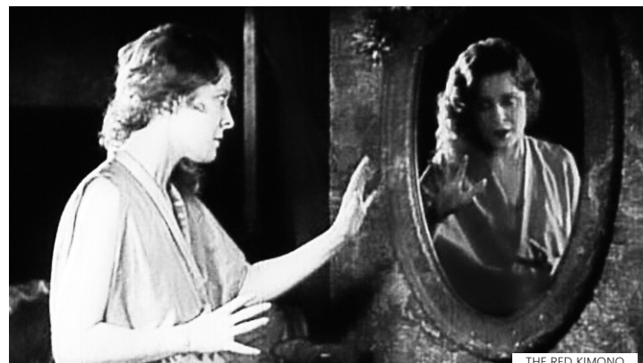
THE RED KIMONA