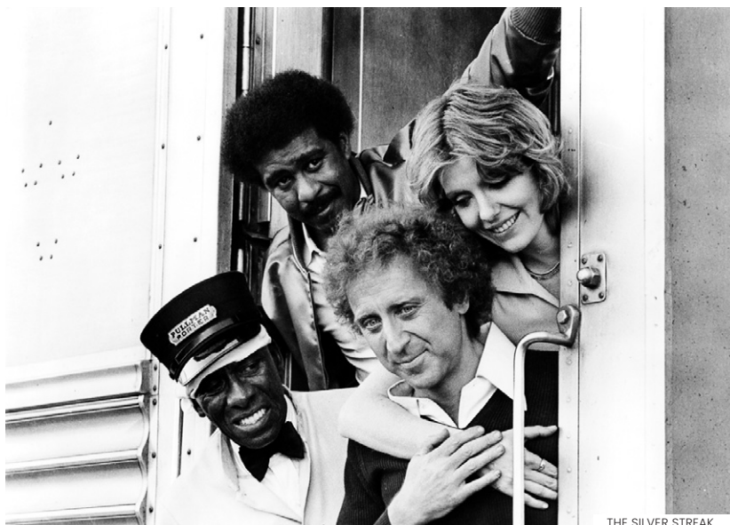
THE SILVER STREAK

R etomamos este mês a “tradição” iniciada em 2020 de apresentar em dezembro uma versão “expandida” da rubrica para oferecer, dentro do espírito da quadra natalícia, uma resposta mais robusta às muitas solicitações dos espectadores da Cinemateca que fomos recebendo ao longo dos 11 meses anteriores. Uma escolha eclética de cinco filmes – três deles absolutamente inéditos nas salas da Rua Barata Salgueiro – programada a partir dos contributos dos nossos espectadores.