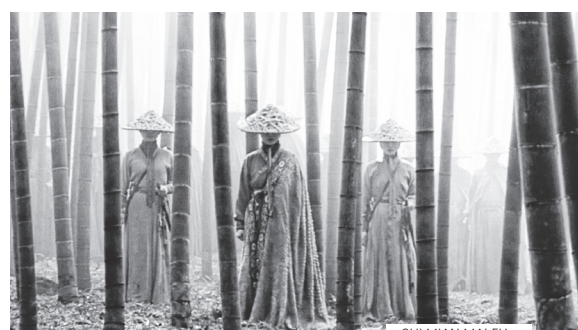
SHI MIAN MAI FU

Protagonizado pela cantora islandesa Björk, THE JUNIPER TREE é uma adaptação de um conto escrito pelos Irmãos Grimm sobre duas raparigas que são obrigadas a fugir da sua aldeia após a mãe ser acusada de bruxaria. Por necessidade de proteção, a mais velha enfeitiça um homem viúvo que vive com o filho de maneira a nunca se separarem. Uma revisitação feminista dos estigmas que associavam as mulheres às práticas de bruxaria na Idade Média. Primeira apresentação na Cinemateca.