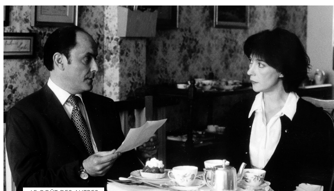
LE GOÛT DES AUTRES