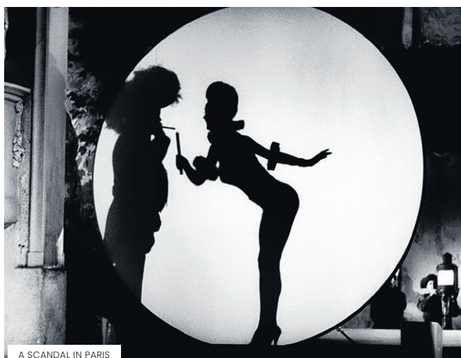
A SCANDAL IN PARIS