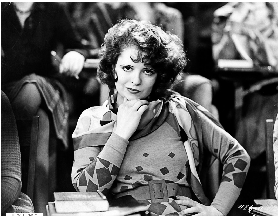
THE WILD PARTY

como “o namorado da América”), com quem se cruza e volta a cruzar num mesmo dia de acasos, estando este comprometido desde miúdo com outra rapariga, não necessariamente interessada em tal noivado. A dança de pares envolve jovens pretendentes, os pais deles e a estonteante liberdade de movimentos de Bow, estrela cintilante do firmamento hollywoodiano dos anos 1920/30. Escreveu acertadamente Jeanine Basinger (a propósito de uma projeção do filme no San Francisco Film Festival 2017), “a ligeireza de GET YOUR MAN não impede que revele uma das marcas de Arzner – uma celebração do triunfo da sexualidade feminina”.