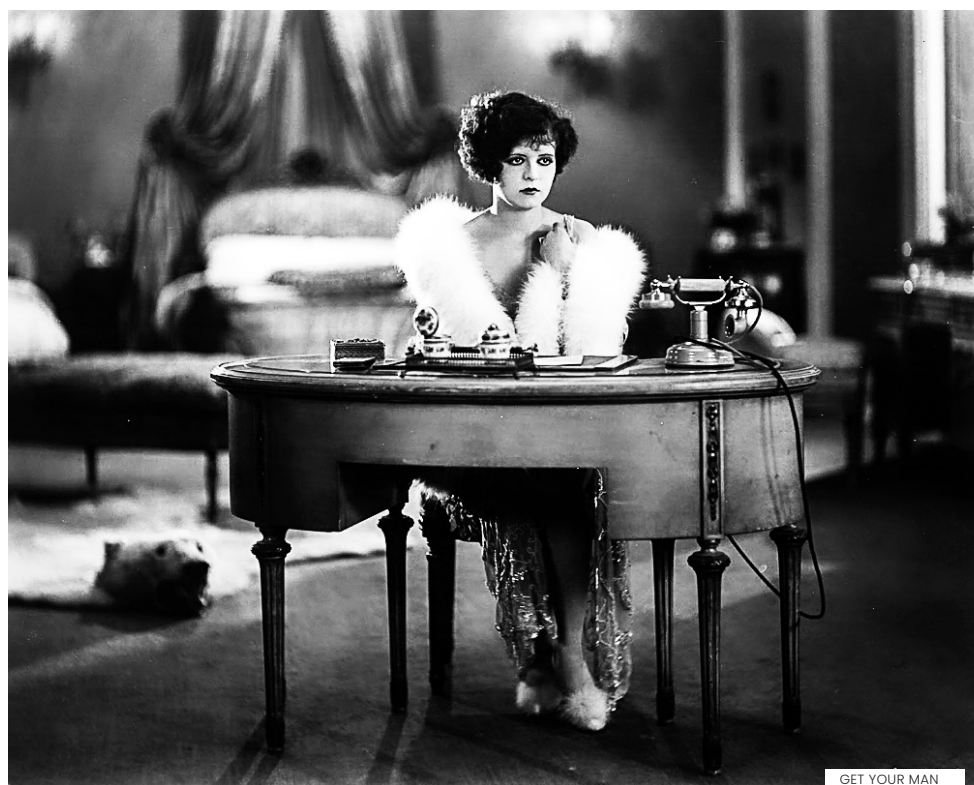
GET YOUR MAN

É dos filmes menos citados de Dorothy Arzner, com