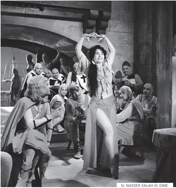
EL NASSER SALAH EL DINE

transforma-se, para Joana, rainha, numa paixão avassaladora pelo marido que a levará à loucura. A declaração de insanidade pela Corte de Burgos impõe-lhe a reclusão no Mosteiro de las Huelgas enquanto Filipe se proclama rei. Uma produção espanhola que contou com coprodução portuguesa da Take 2000.