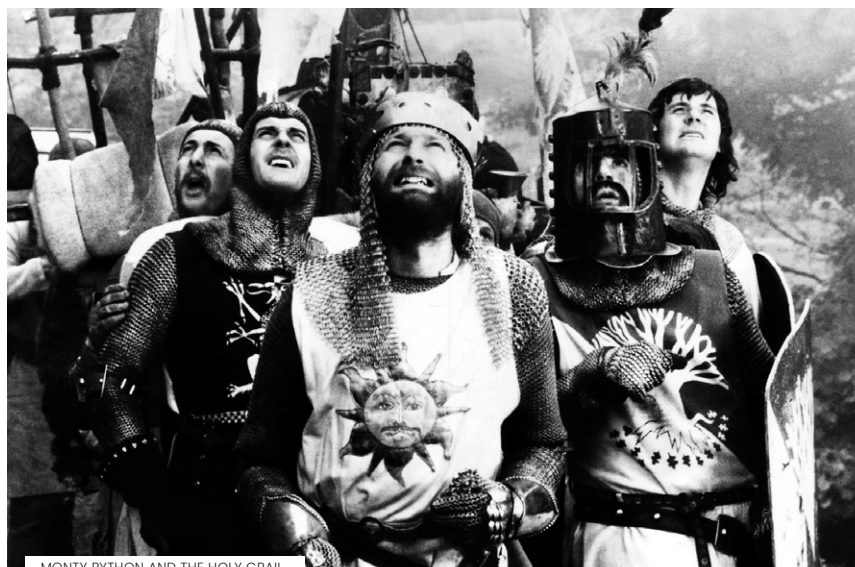
MONTY PYTHON AND THE HOLY GRAIL

O primeiro épico de Anthony Mann para as produções Samuel Bronston. Uma admirável adaptação da lenda de Cid, o Campeador e o seu combate pela reconquista da Espanha aos mouros que a ocupavam, e do seu amor pela bela Chimene. Mann filma as aventuras do Cid como se se tratasse de um herói do Oeste e dá à paisagem a mesma pujança dramática dos seus westerns. A exibir em cópia digital.