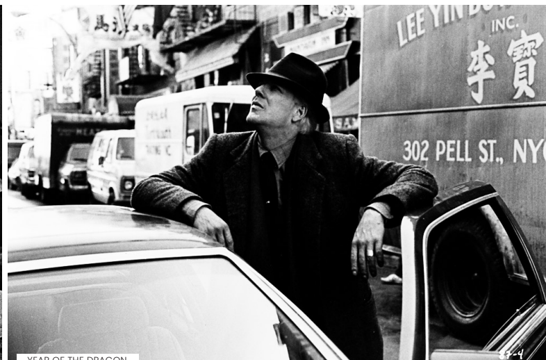
YEAR OF THE DRAGON