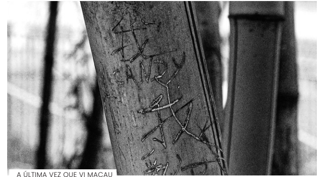
A ÚLTIMA VEZ QUE VI MACAU

Nesta rubrica regular, este mês assinalamos o lançamento em DVD de TEMPOS DIFÍCEIS de João Botelho (realizador a quem a Cinemateca dedicou este ano uma retrospectiva quase integral e um catálogo sobre a sua obra) que terá lugar no espaço da livraria Linha de Sombra nos 39 Degraus a anteceder a exibição desse filme em sala. Trata-se de uma edição da Academia Portuguesa de Cinema em colaboração com a Cinemateca no contexto da "Coleção da Academia", a qual visa recuperar e editar obras emblemáticas do cinema português, contribuindo em simultâneo para a sua preservação e difusão junto de um público alargado em versões restauradas digitalmente. Apresentamos também nesta rubrica, associado ao lançamento do livro ReFocus: The Films of João Pedro Rodrigues and João Rui Guerra da Mata – conjunto de ensaios sobre os filmes da dupla de realizadores organizado pelos investigadores José Duarte e Filipa Rosário e publicado pela Edinburgh University Press – o filme A ÚLTIMA VEZ QUE VI MACAU.