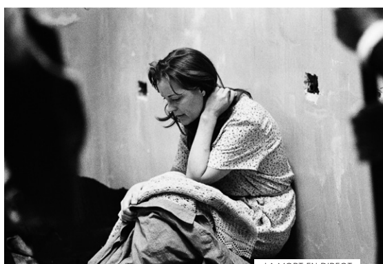
LA MORT EN DIRECT

À época da sua estreia visto como uma variação menor de DOUBLE INDEMNITY, este filme escrito por Dalton Trumbo e realizado por Joseph Losey acabou por ser considerado não só um dos melhores da fase americana de Losey, antes da sua fuga para Inglaterra, devido ao período negro da “caça às bruxas”, vulgo McCarthismo, como conquistou um culto crescente desde o seu restauro e relançamento no mercado home cinema . Protagonizado por Van Heflin e Evelyn Keyes, esta história de traição e homicídio, enredo particularmente perverso que surpreende e choca ainda hoje, teve como produtor não creditado John Huston, marido de Keyes, que pretendia fazer deste título um veículo para a sua mulher. Depois de ter caído no esquecimento, THE PROWLER tem sido objeto de uma importante reavaliação crítica: Eddie Muller, o “czar do noir”, soube ver nele uma crítica feroz à sociedade americana e Bertrand Tavernier considerou-o um dos maiores noirs da história. Primeira apresentação na Cinemateca.