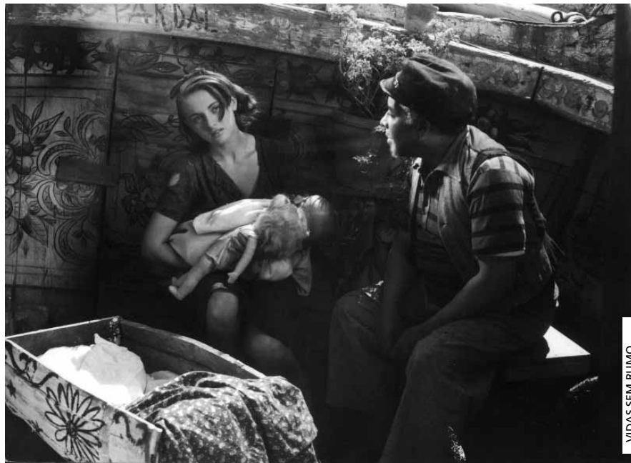
VIDAS SEM RUMO