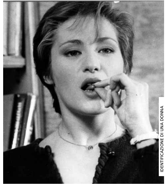
IDENTIFICAZIONE DI UNA DONNA