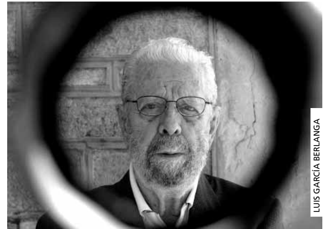
LUIS GARCÍA BERLANGA