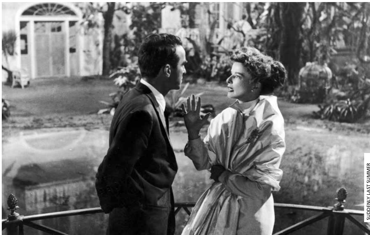
SUDDENLY LAST SUMMER

Este mês, o nosso percurso dos sábados pelo "Primeiro Século do Cinema" será encurtado devido ao facto de três sessões do dia 11 serem dedicadas à apresentação da versão integral de JOSÉ E PILAR. Mas nem por isso será menos rico e variado do que de costume. Ao lado de clássicos de Tourneur, Renoir e Mankiewicz, poderemos rever modernos clássicos do cinema francês, de Pialat, Rohmer, Truffaut e Demy (o raríssimo LADY OSCAR), além de MY BEAUTIFUL LAUNDRETTE, de Stephen Frears e de PROFESSIONE REPORTER, de Antonioni. E também faremos incursões a territórios cinematográficos muito mais raros e menos frequentados: as pasolinianas STORIE SCCELLERATE de Franco Citti, uma extravagância de Jess Franco (OS AMANTES DA ILHA DO DIABO), um documentário político de Emile de Antonio (UNDERGROUND) e um raro filme do filipino Mike de León. No domínio do cinema mudo (que Louis Delluc definiu como a "música do silêncio"), de presença obrigatória nestes sábados, um de Jean Renoir e o outro de Boris Barnet e duas raridades: uma luxuosa versão alemã de LUCREZIA BORGIA e o belo THE REAL ADVENTURE, de King Vidor. Os caminhos do cinema são muito variados e a curiosidade é o melhor guia do espectador.