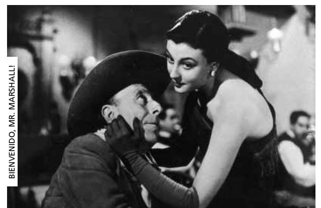
BIENVENIDO, MR. MARSHALL!