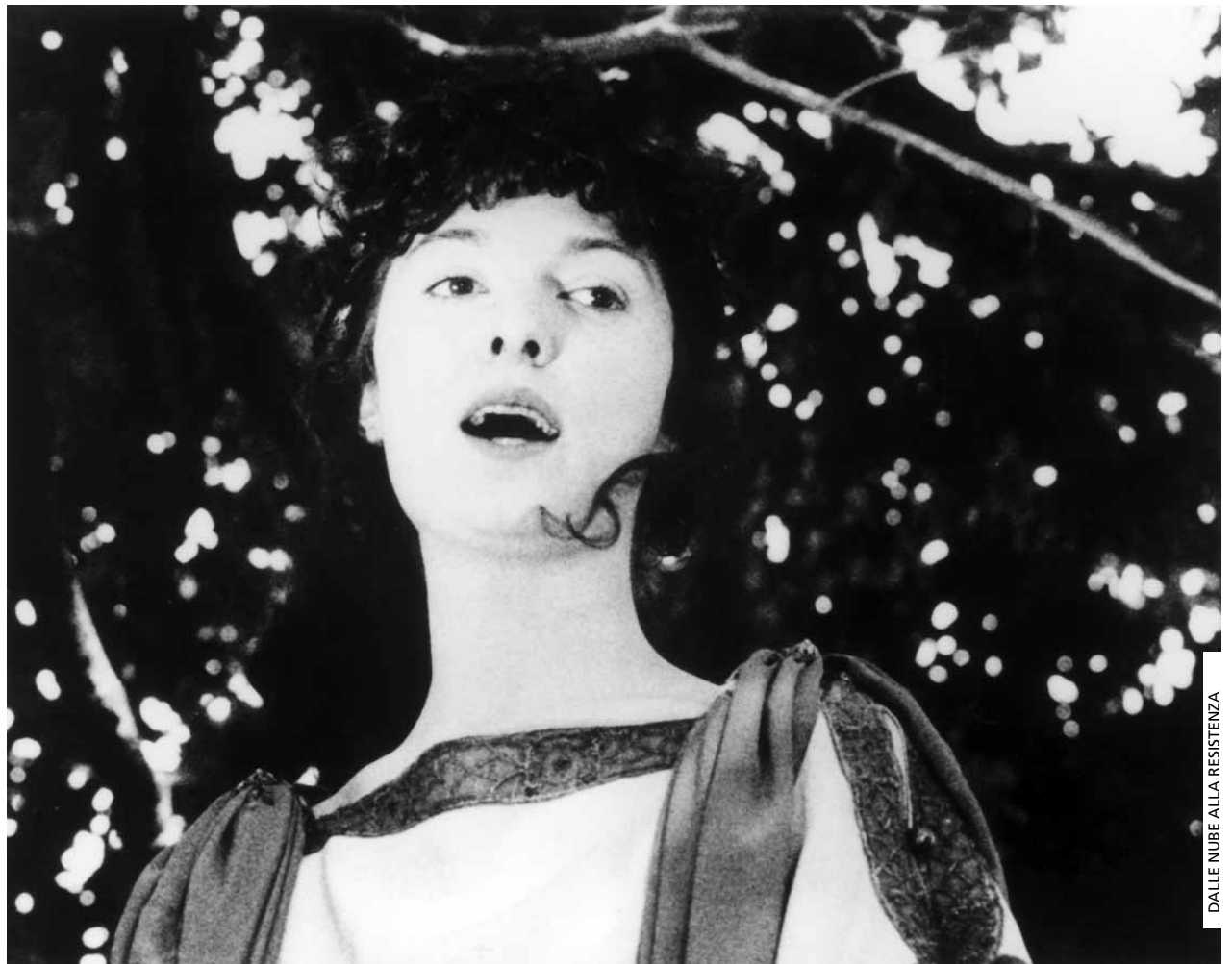
DALLE NUBE ALLA RESISTENZA

> Sex. [2 Março] 18:00 | Sala Luís de Pina