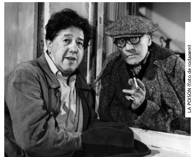
LA POISON (foto de rodagem)

> Qua. [29] 19:00 | Sala Dr. Félix Ribeiro