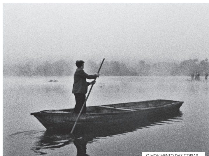
O MOVIMENTO DAS COISAS

lista e um fotógrafo na Lisboa de 1973. Vindo do cinema amador e dos cineclubes, Rogério Ceitil começou por assinar GRANDE, GRANDE ERA A CIDADE (1971), uma obra em que contara com a colaboração de Lauro António e que nunca foi estreada por interdição da Censura após uma única exibição no Festival de Santarém de 1972. Mercê da pequena história de uma disputa de autoria referente a esse primeiro filme (de que o argumento de CARTAS NA MESA terá sido evocação), as referências a esta segunda obra acabaram por ser parcialmente desviadas do que mais contaria, a saber, o facto de estar em causa uma das raras incursões do nosso cinema da altura num tipo de filmagem direta e dir-se-ia desarmada, que, para além de possíveis fraquezas intrínsecas, carecia tanto de tradição como de contexto. Filmado poucos meses antes do 25 de Abril, estreou-se em janeiro de 1975, porventura mais uma vez desenquadrado. A exibir em cópia nova 35mm.