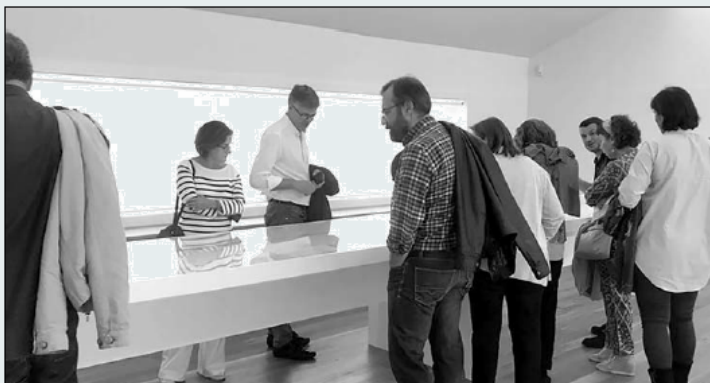
Professores e convidados visitaram a Casa de Cinema Manoel de Oliveira

Manoel de Oliveira integrada no plano de atividades para o este ano letivo. A atividade integrou uma equipa de professores que fazem parte do projeto, e alguns convidados.