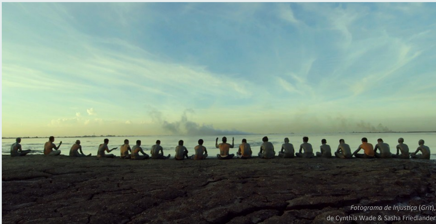
Fotograma de Injustiça (Grit), de Cynthia Wade & Sasha Friedlander

Em novembro, divulgamos atividades dinamizadas durante a 25. a Edição do Festival de Cinema Ambiental da Serra da Estrela (Cine-Eco), uma iniciativa que mobiliza o poder do cinema para alertar para os problemas ambientais, e que tem captado de forma significativa a participação de um número crescente de escolas. Destacamos três projetos que dão mais visibilidade à fruição e à experiência do cinema em contextos pedagógicos: o projeto Cinema Insuflável , o novo festival DOBRA (Braga) e o projeto Alto Cinema . Também é tempo de fazer a divulgação de iniciativas cinematográficas desenvolvidas pelas escolas, instituições académicas e entidades ligadas setor. Saudamos ainda o lançamento do projeto Público na Escola . Finalmente, divulgamos a programação mensal do dispositivo «O Cinema está à tua espera».