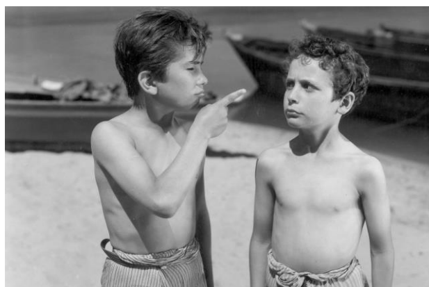
Atividades cinematográficas em contexto escolar (Peso da Régua); fotograma de Aniki-Bóbó (1942), Manoel de Oliveira.