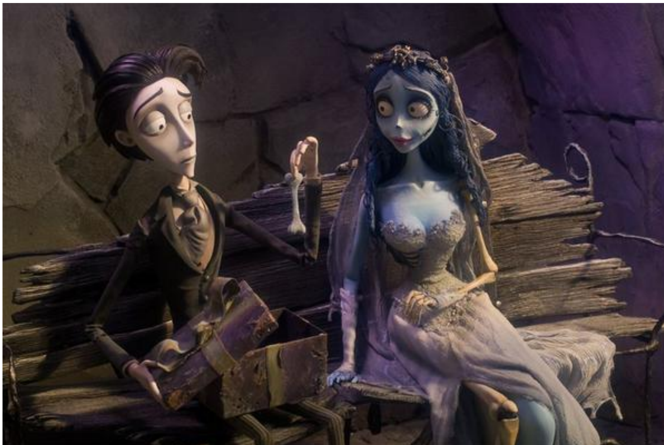
Fotograma de A Noiva Cadáver (2005), de Tim Burton e Mike Johnson

Neste número de abril divulgamos uma proposta de reflexão sobre o filme Persépolis , de Marjane Satrapi, realizada no âmbito de uma Ação de Formação do PNC, e os planos de atividades cinematográficas implementados na Escola Básica de Manhente (Agrupamento de Escolas Alcides de Faria – Barcelos), no Agrupamento de Escolas João Araújo Correia (Peso da Régua) e no Agrupamento de Escolas da Lixa. Destacamos ainda a realização do Seminário Cinema e Educação: desafios e oportunidades , em Barcelos, bem como o Ciclo de Cinema «Infância e Realismos», em Vila Franca de Xira, entre outros eventos.