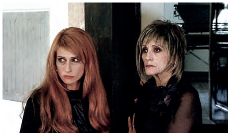
VANITAS OU O OUTRO MUNDO

“A acompanhar a retrospectiva da sua obra, 20 escolhas de Jorge Silva Melo em 2020. E um texto.”