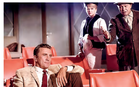
TWO WEEKS IN ANOTHER TOWN