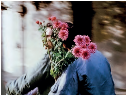
NAMAY-E NAZDIK / CLOSE-UP